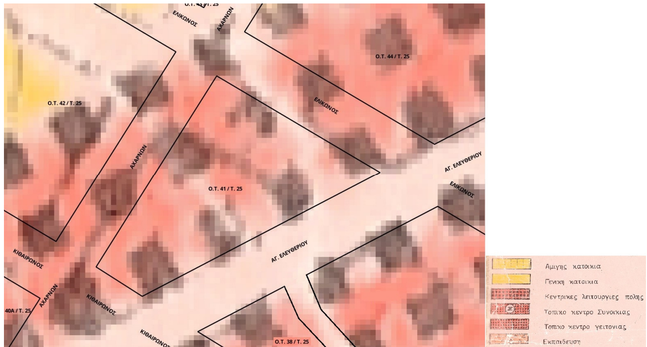
Εικόνα 1: Απόσπασμα Γ.Π.Σ. (ΦΕΚ 79/Δ/04-02-1988) στο Ο.Τ.41/Τ.25.

Η περιοχή εντάχθηκε στο σχέδιο πόλης με το από 19-11-1892 Β.Δ. (ΦΕΚ 412/Α/21-11-1892), ενώ ακολούθησε το από 18-11-1926 Π.Δ. (ΦΕΚ 417/Α/26-11-1926), τροποποίησης εγκεκριμένου ρυμοτομικού σχεδίου για τη μετατόπιση της οικοδομικής-ρυμοτομικής γραμμής επί των οδών Κιθαιρώνος και Αχαρνών.